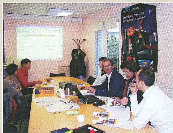
Les « rencontres de la DAPI » au CDAS de Morlaix.