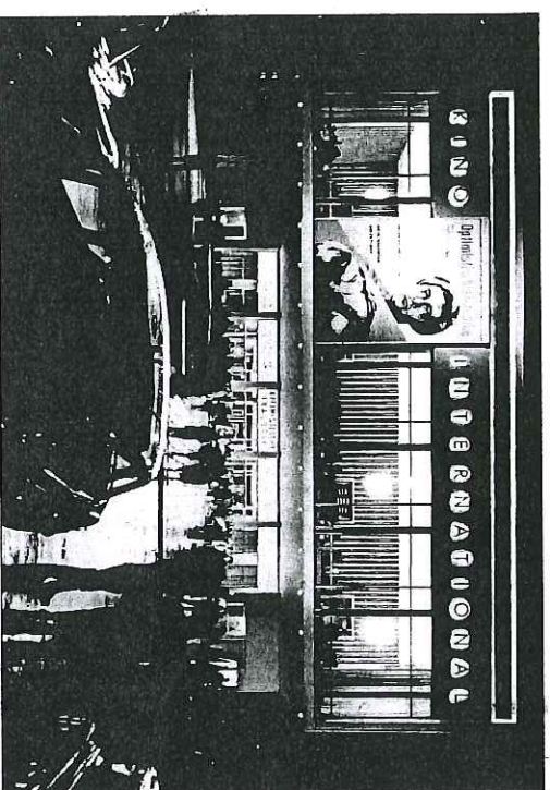
Berlin, Kino International, sur la Karl-Marx-Allee. Carte postale des années 1960.