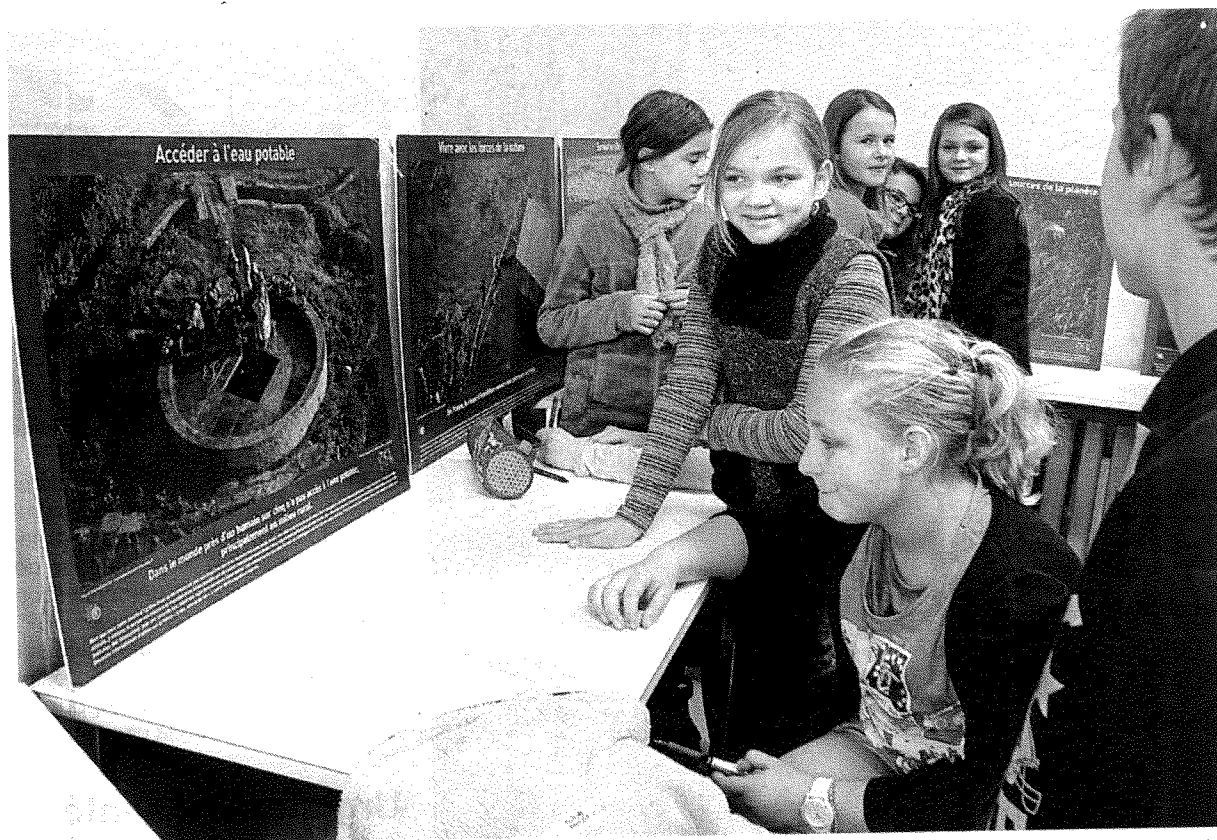
Atelier de lancement de l'Agenda 21 avec les 6 e . Chaque groupe devait trouver une phrase choc en lien avec la protection de l'environnement.

« L'idée est d'associer les élèves en amont pour que chacun s'approprie